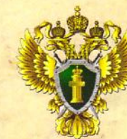
ПРОКУРАТУРА ГОРОДА САМАРЫ